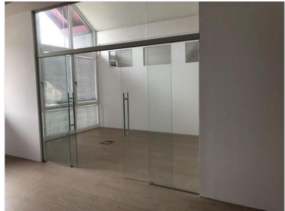
Blick aus Büro 2