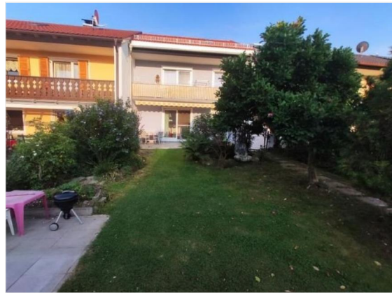
Garten bei Abendsonne